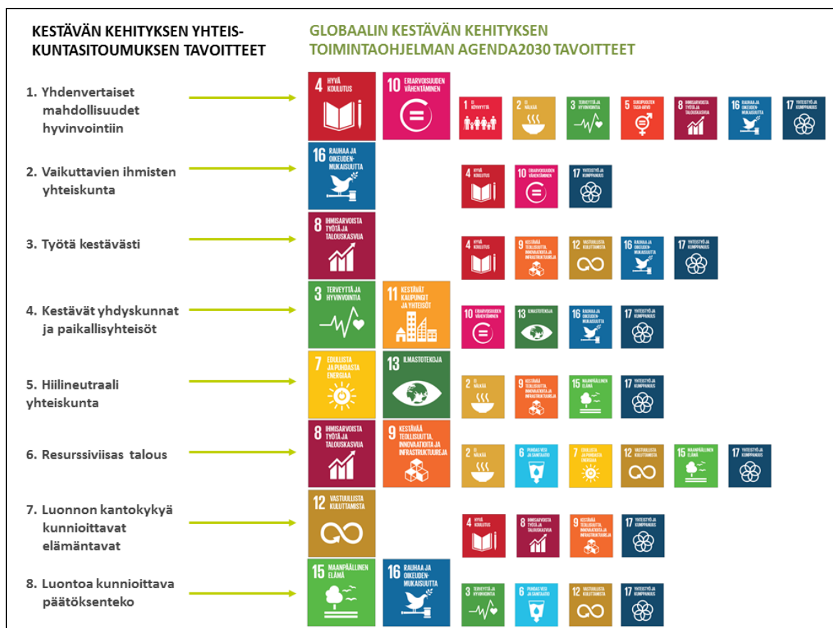
Kuva: Yhteiskuntasitoumuksen tavoitteiden ja Agenda2030 tavoitteiden (SDGt) vastaavuus

Kestävän kehityksen toimikunta tarkasteli huhtikuussa 2016 Kestävän kehityksen yhteiskuntasitoumuksen ja globaalin kestävän kehityksen toimintaohjelman (Agenda2030) vastaavuutta. Kestävän kehityksen yhteiskuntasitoumuksen tehtiin muutoksia, joiden jälkeen kestävän kehityksen toimikunta totesi yhteiskuntasitoumuksen olevan hyvin linjassa globaalin kestävän kehityksen toimintaohjelman ja sen tavoitteiden kanssa.