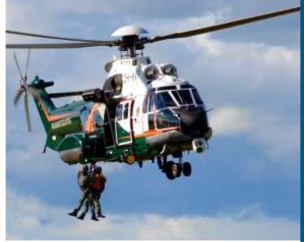
Rajavartiolaitoksen H215 Super Puma.

Etsintä- ja pelastuskapasiteetin riittävyys on haaste taloudellisen toiminnan sekä laiva- ja lentoliikenteen lisääntyessä arktisella alueella. Vuonna 2011 solmitun Arktisen lento- ja meripelastusyhteistyön sopimuksen toimeenpano on tärkeää. Arktisen rannikkovartiostofoorumin perustaminen on tervetullut toimi. Tämän foorumin puitteissa Suomen rajavartiolaitos vahvistaa yhteistyötä meriturvallisuuden edistämiseksi etsintä- ja pelastustoiminnan sidosryhmien kanssa. Tarkoituksena on vaihtaa tietoa parhaista käytännöistä, yhdenmukaistaa vakiintuneita toimintatapoja ja parantaa yhteentoimivuutta. Pääharjoitus pidetään vuoden 2019 alussa Arktisen rannikkovartiostoviikon aikana.