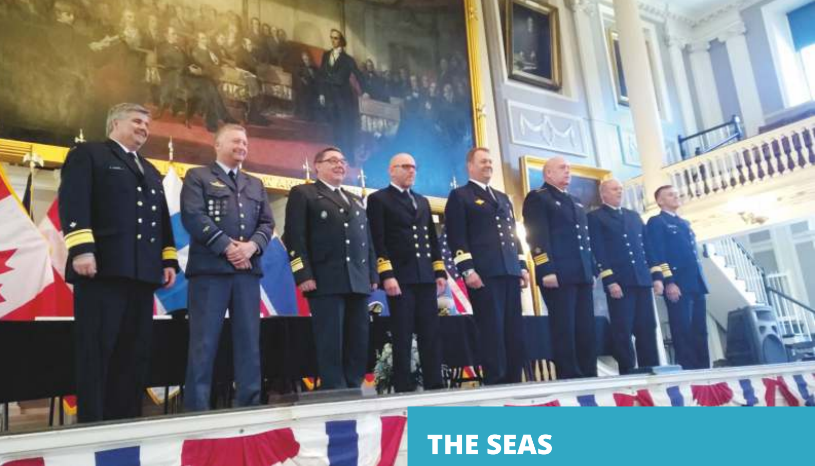
The Arctic Coast Guard Forum in the USA on 9–10 June 2016. From left to right, representatives of Canada, Denmark, Finland, Iceland, Norway, Russia, Sweden and the USA.