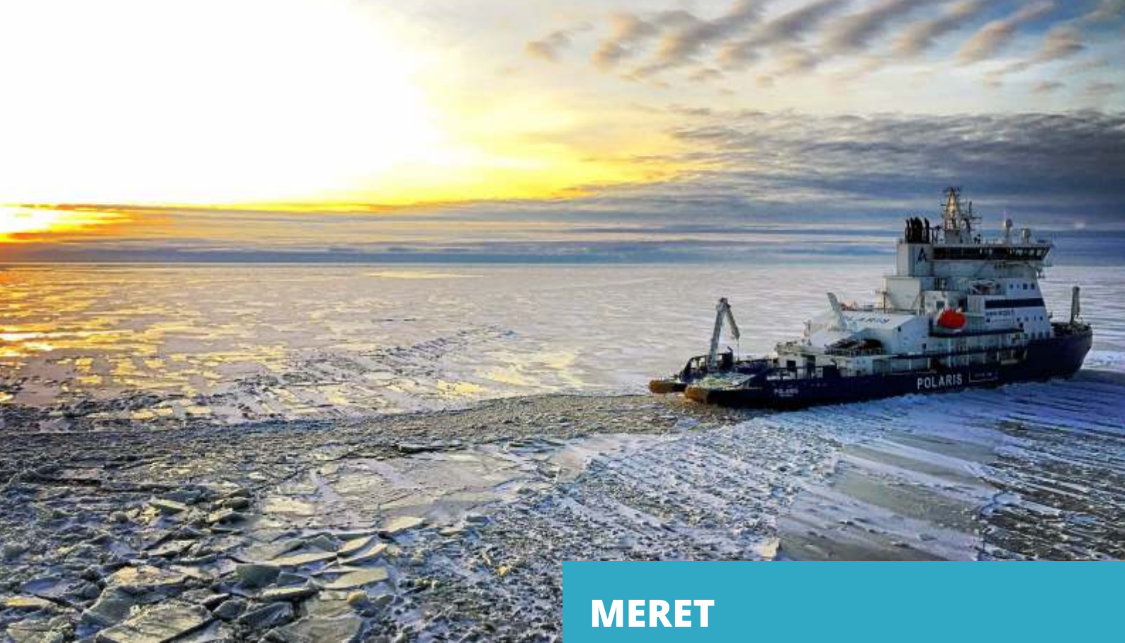
Maailman ensimmäinen LNG-käyttöinen jäänmurtaja Polaris.