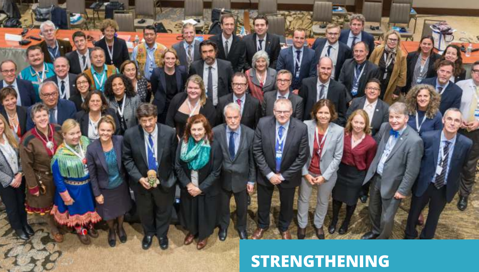
Senior Arctic Officials and Permanent Participants in Portland, Maine in 2016.