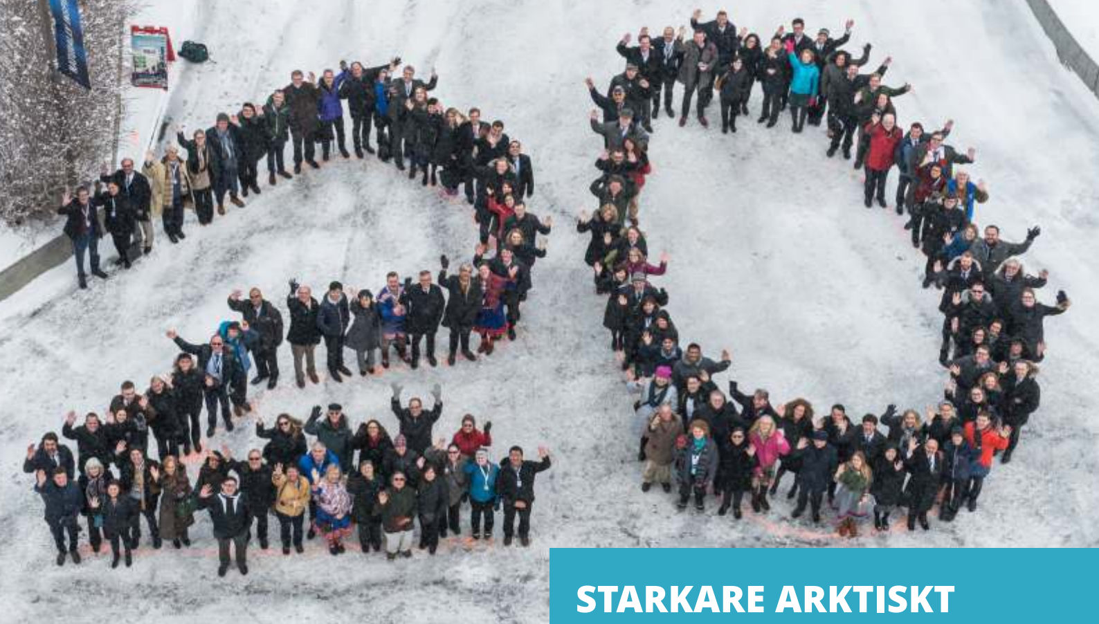
Deltagare vid Arktiska rådets möte i Fairbanks, Alaska, 2016.