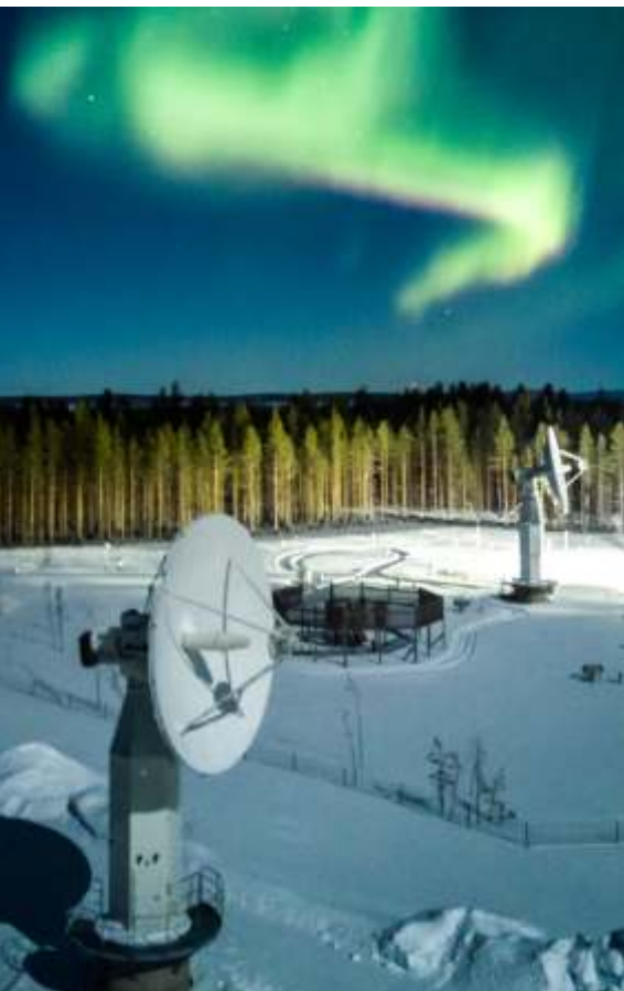
Dálkedihtaga lágádusa Soađegili Ártkalaš gomuvuodaguovddáža ođđa satelihtadata vuostáiváldinanteanna váldui geavahussii 2017.

Suopma lea pláneme bargat ovdanbuktojumi satelihta bokte dáhpáhuvi dáhtasirdima birra. Dainna Suopma áigu čalmmustahttit dan, ahte ártkalaš guovllus eai leat juohke sajis oktavuodát. Dán hárjehusas, satelihtadáhtha mii sisttisdoallá dieđuid jiekŋadiliin, váldojuvvo vuostá Suoma meteorologalaš instituhta ártkalaš gomuvuodaguovddážiis (Finnish Meteorological Institute's Arctic Space Center) ja nuppástuhttojuvvo ja sáddejuvvo ovddasguvlui measta reálaáiggis dámpii mii johtá ártkalaš guovllus.