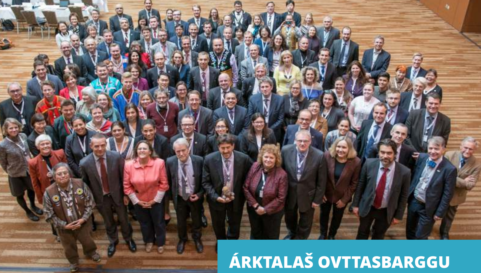
Árktalaš ráđi virgeolmmoškomitea Alaska Anchorage 2015.